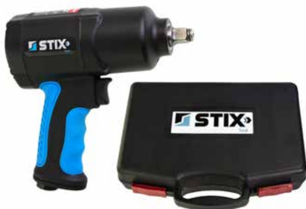
Stix Tool: udarowy klucz STT-15 z walizką transportową

Mimo że na rynku nie brakuje dostawców tego typu urządzeń, firma zdecydowała się wprowadzić je pod własną marką – jako uzupełnienie całościowej oferty, obejmującej wszelkie akcesoria niezbędne w procesie naprawy koła. Jeśli oferowany jest bardzo szeroki zakres materiałów naprawczych (każdego rodzaju łątki, wkłady, kołki, kleje, sznury butylowe), a także ciężarki do wyważania, nabijane i klejone, to naturalne staje się zaproponowanie osprzętu, za pomocą którego można zdemontować koło i przygotować oponę do naprawy. Warsztat, dokonując zakupu materiałów wulkanizacyjnych, od razu może zamówić w jednym miejscu potrzebne narzędzia przeznaczone do profesjonalnego zastosowania. Na przykład pneumatyczny klucz udarowy STT-15 z uchwytem narzędziowym o rozmiarze 1/2", stanowiący doskonały przykład urządzenia nieodzownego w każdym serwi-